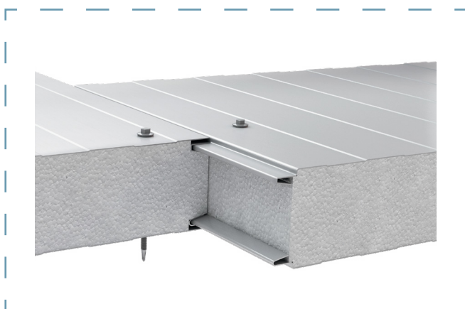
Schemat łączenia płyt