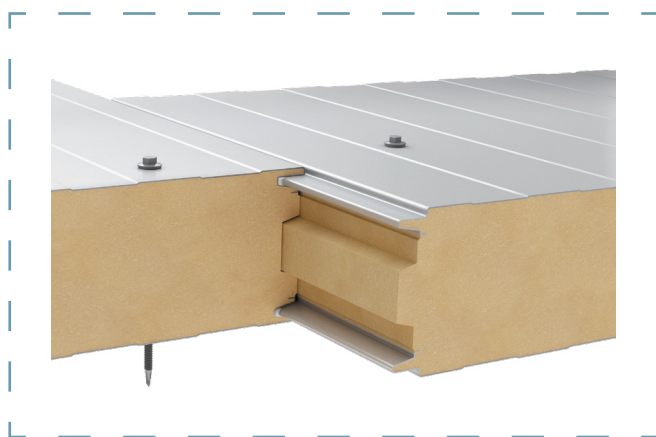
Schemat łączenia płyt