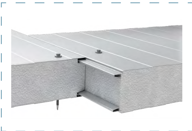
Schemat łączenia płyt